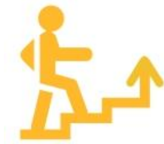
Логотип трека «Орлёнок – Лидер»

Ценности, значимые качества трека: дружба, команда