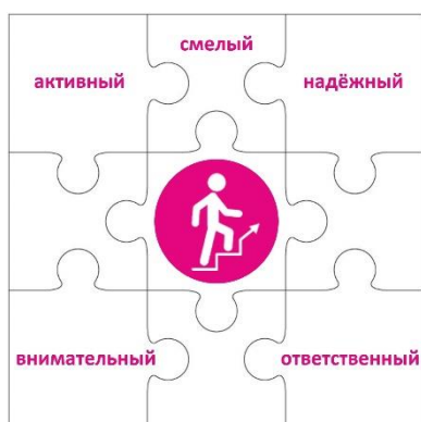
Конструктор «Лидер» 2 класс

Чтобы быть лидером, нужно много знать, уметь вести за собой, постоянно развиваться. Личность лидера многогранна, она словно складывается из множества разных пазлов, которые в целом дают яркую и интересную картинку. Конструктор «Лидер» представляет собой большой пазл, где центральный элемент – символ трека – человек, поднимающийся вверх по лестнице. Остальные части этого пазла – элементы небольшого размера, примерно формата,