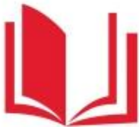
Логотип трека «Орлёнок – Эрудит»