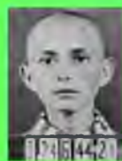
Стр. 3 Книга которую надо почитать