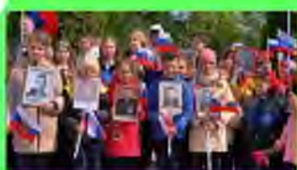
Стр. 2 Школа чтит День Победы

Елизавета Шляхова