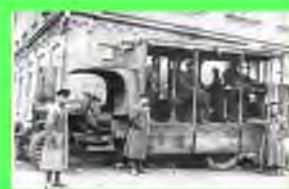
Стр. 5 Военные автомобилисты