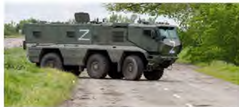
Тайфун-К. Скорее всего войск Росгвардии России в зоне СВО. Построен на базе КАМАЗ. Имеет противопульное и противаминное бронирование

Сегодня это самая распространенная специальность в российских