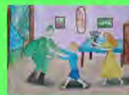
Стр. 6 День Победы