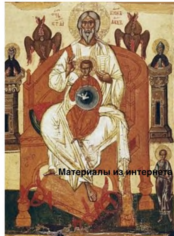
Материалы из интернета

время молитве. Работая, мы как бы показываем Богу своё неуважение. Стоит отложить наши дела, например, по дому или огороду. Работать можно в том случае, если этого требуют обстоятельства. В нашем огромном современном мире есть столько работ, которые нельзя пропустить или отложить, которые требуются в любое время, которые не следят за числом в календаре. Это врачи, полиция, пожарные...» Наверно, моим главным вопросом был этот: «Почему такой праздник появился? Что произошло в этот день?». Оказывается, в этот день мы вспоминаем событие, которое произошло через пятьдесят дней после Воскресения Христова – Святой Дух сошёл на апостолов, и они отправились проповедовать учение Христа Воскресшего всем народам во всех землях. Я задавала вопросы об обычаях, обрядах и суевериях. Бабушка лишь улыбалась. Наверно, удивлялась моей любознательности. А после тихо, не спеша, отвечала. Так и началось моё знакомство с церковными праздниками, а именно Троицей. Сейчас же я знаю намного больше. И теперь более осознанно прихожу на службу в церковь. Я понимаю, зачем это нужно делать с более духовной точки зрения, с точки зрения моего мировоззрения. Обычно, в день Троицы после посещения церкви наша семья собирается за большим богатым