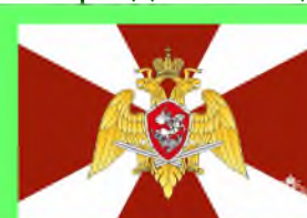
Стр. 5 "Особое" войско