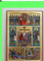
Стр. 4 Великий пост