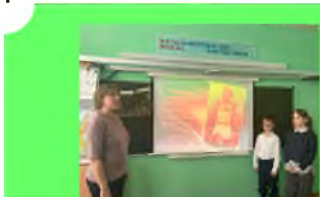
Стр. 2 ГТО