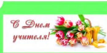
Стр. 6 С днём учителя