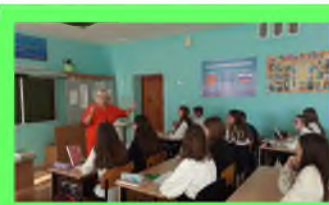
Стр. 5 Математика в нашей жизни