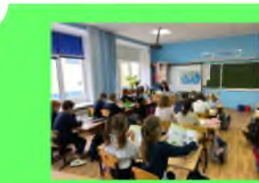
Стр. 3 День самоуправления