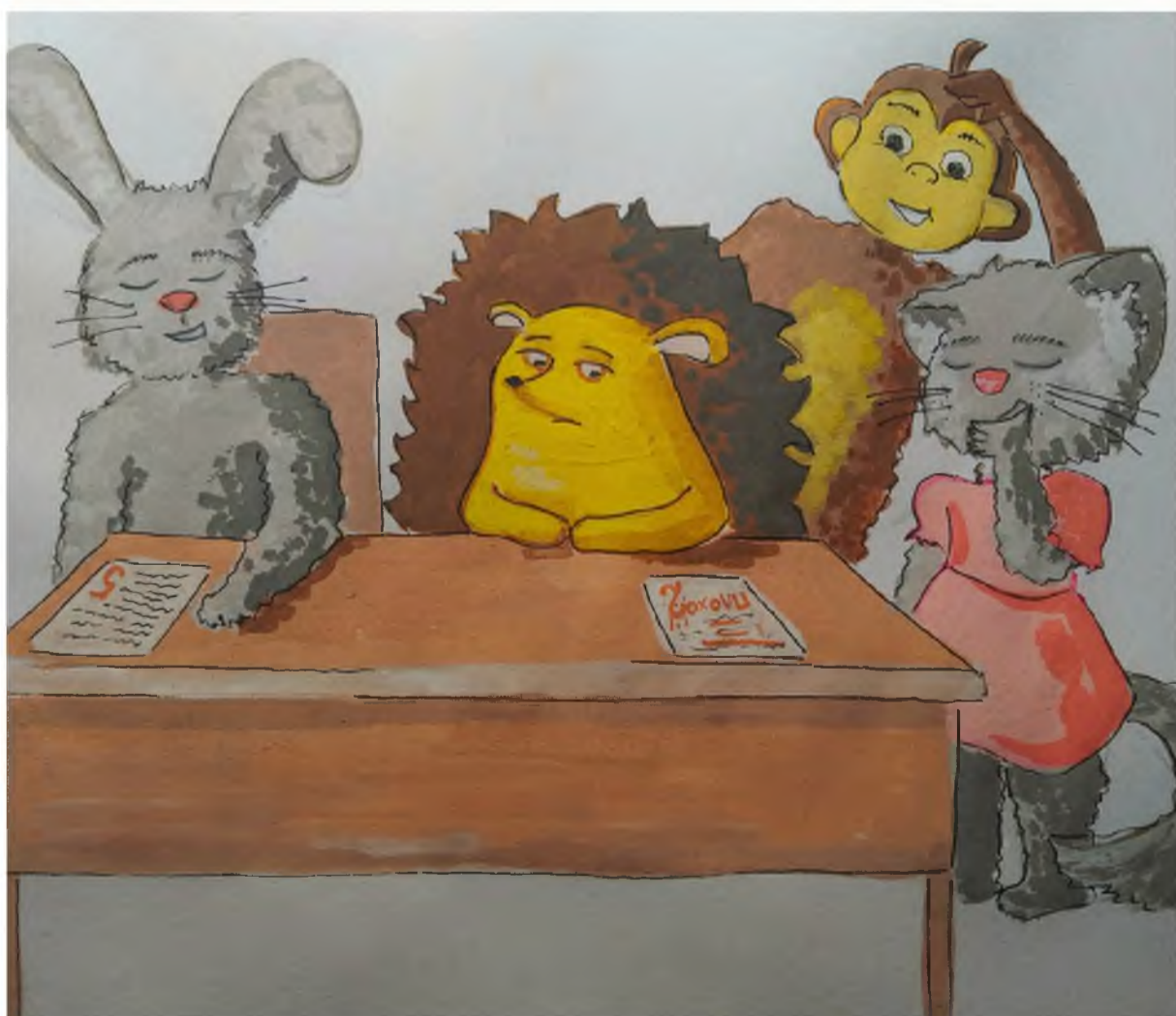
Рисунок Марии Карташевой