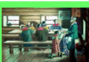
Стр. 4 Образование по деревнерусски