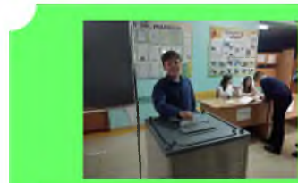
Стр. 2 Выборы президента ШР

нагрузкой, и я согласился. И в первый же год мне дали заочную группу, взрослых мужчин, и я, ещё совсем юный, намного младше них, рассказывал им про сельскохозяйственную технику и про эксплуатацию машин, тракторов. Потом армия, снова техникум и обучение в Московском Государственном аграрно-инженерном Университете, работа в качестве преподавателя технических дисциплин. Теперь работаю у Вас в школе. (продолжение на 2 странице)