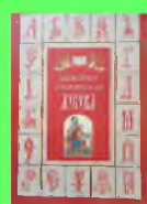
Стр. 3 Почитаем?