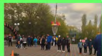
Стр. 2 Моя спортивная семья