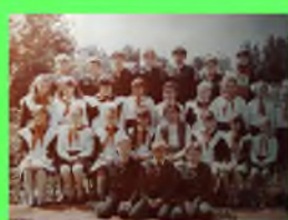
Стр. 4 100 лет пионерии