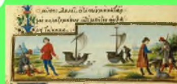
Стр. 6 Миниатюры