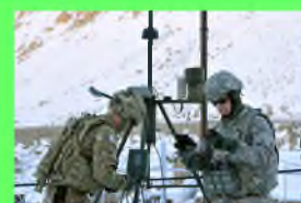
Стр. 5 Какую профессию выбрать?