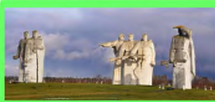
Стр. 3. Вспомним их поимённо