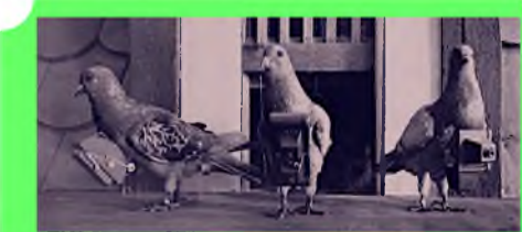
Стр. 2. Мы в акции #ГолубьМира