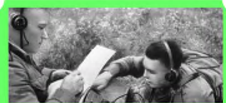
Стр. 5. День радио