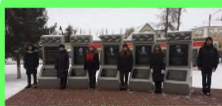
Стр. 4. Жизнь идёт, а ценности вечны