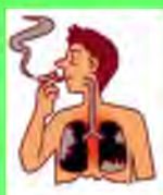
Стр. 3 Опасные заблуждения