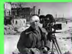
Стр. 5 герои за кадром