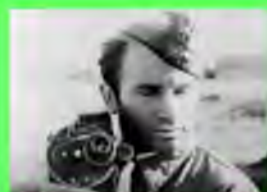
Стр. 4 Наше оружие тоже бьёт по врагу