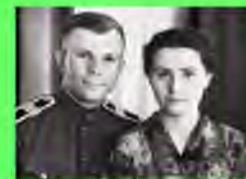
Стр. 6 О любви