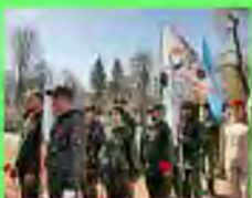
Стр. 2 «Вахта памяти»