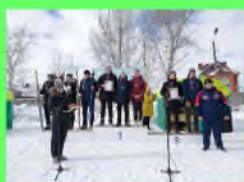
Стр. 2 Бежали биатлон

Мы очень надеемся, что спорт в нашем городе будет развиваться и процветать.