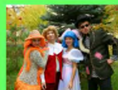
Стр. 5 Всемирный день театра