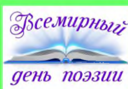
Стр. 3 День поэзии