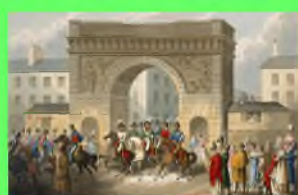
Стр. 4 Экскурс в историю