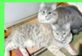
Стр. 6 Братья наши меньшие