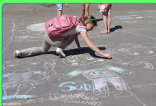
стр. 3 Пройдемся по искусству