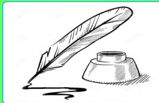
стр. 6 Литературная страничка