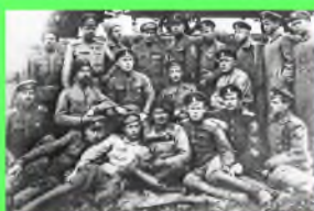
Стр. 4 Ледяной поход