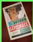
Стр. 3 Труд насквозь пропитанный болью