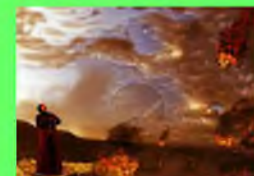
Стр. 6 Конец света