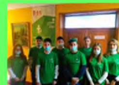
Стр. 5 Мы в WorldSkills