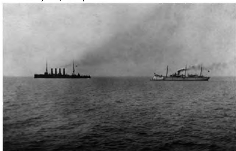
«Варяг» и «Кореец» выходят на бой.