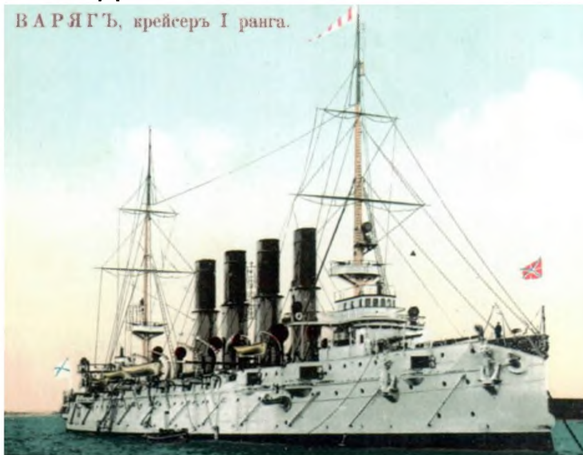
ВАРЯГЪ, крейсеръ I ранга.

На «Варяге» было 12 152-мм пушек системы Канэ. Орудия были разделены на две батареи по шесть пушек: носовую и кормовую. Все они были установлены на специальных выступах, которые вы-