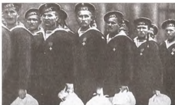
Члены экипажа крейсера «Варяг» с подарками на Знаменской площади. Санкт-Петербург. 1904 г

Руднев руководил боем, несмотря на ранения. Но, несмотря на огонь и большие разрушения, «Варяг» вёл прицельный огонь по японскому судну из всех оставшихся своих орудий. «Кореец» следовал тому же. Выдержав неравный бой и не спустив флага перед японской эскадрой, русские моряки, не сда-