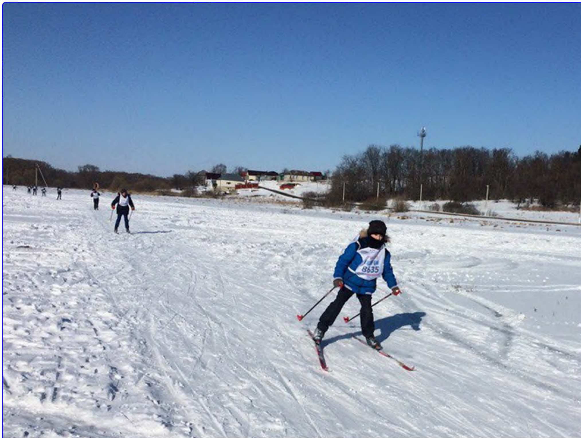
На лыжне