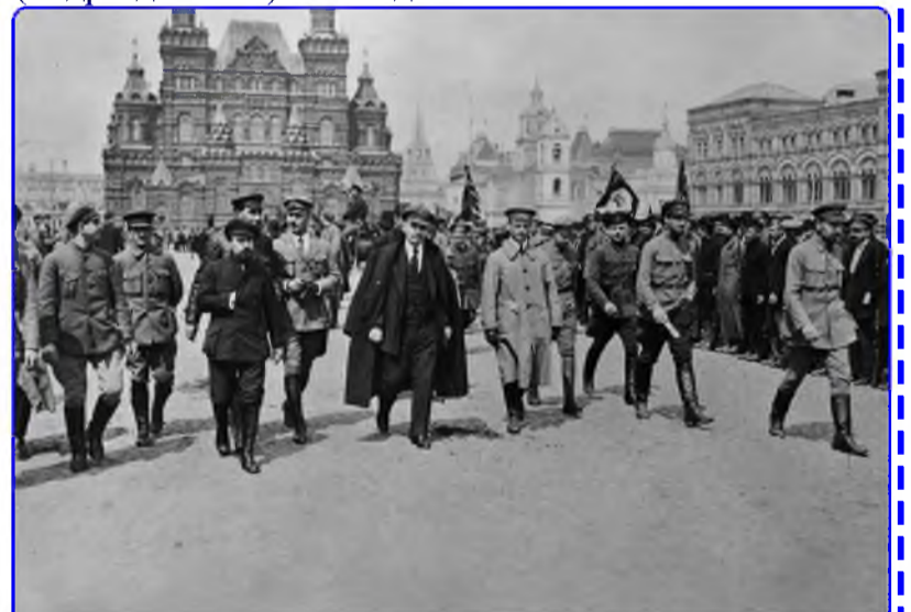
В. Ленин на параде частей Всеобуча в Москве, Май 1919 г.