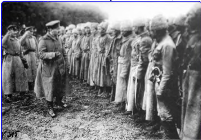
Л. Д. Троцкий в части Красной Армии. Свяжск, Август 1918 г.

Самсонов Александр https://topwar.ru История