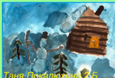
Таня Покалюхина 2 Б