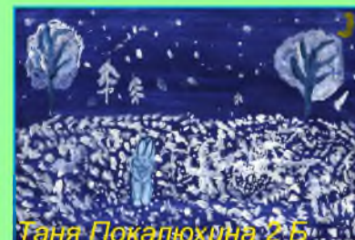
Таня Покалюхина 2 Б