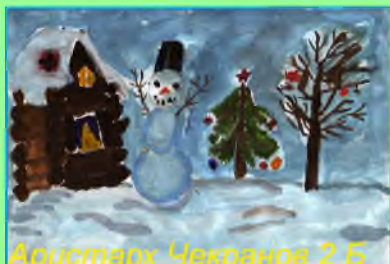
Аристарх Чекранов 2 Б