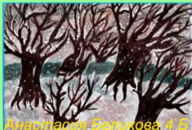
Анастасия Беликова 4 Б