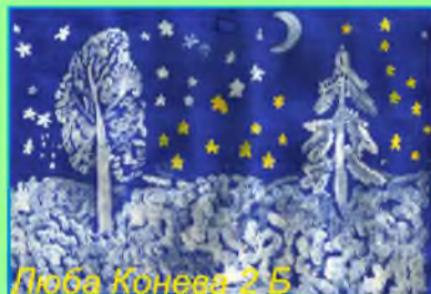
Люба Конева 2 Б