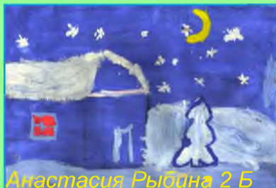
Анастасия Рыбина 2 Б