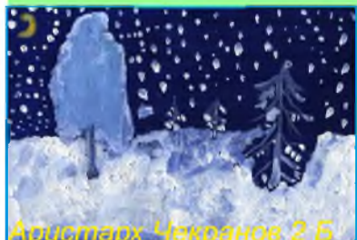
Аристарх Чекранов 2 Б