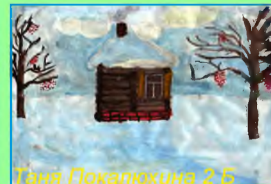
Таня Покалюхина 2 Б