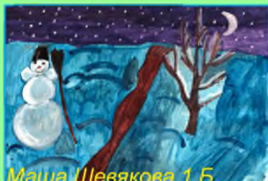
Маша Шевякова 1 Б