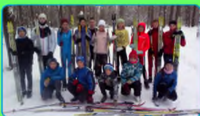
Стр. 2 Пролетевшие каникулы