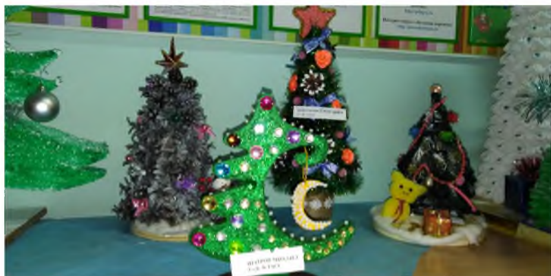
Арина Астафурова выпускница школы

Зима Лист календаря перевернулся, Наступил декабрь на дворе. Все деревья инеем покрылись, Все дома стоят, как в серебре.