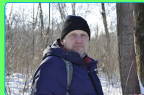
Стр. 5 Профессия - тренер