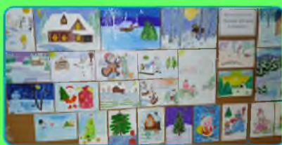
Стр. 3 Торжественный и уютный праздник