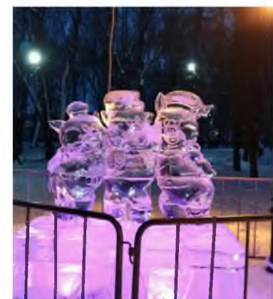
Фото предоставлено Екатериной Зайцевой 7 класс

На ледянку пса сажайте!» Мы катались, веселились, Все в снегу мы извозились. Как же здорово! Ура! Что пока ещё зима.