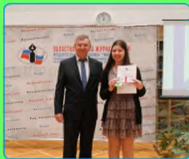
стр. 3 Всё лучшее впереди!