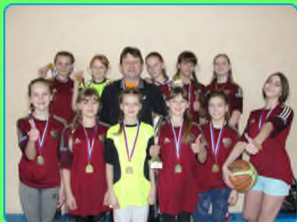
стр. 2 В баскетболе мы первые