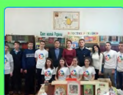
стр. 5 Впереди - серьезная работа