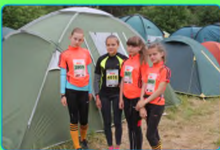
стр. 2 Как я провел лето