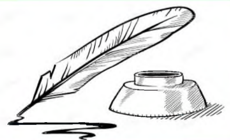
стр. 6 Литературная страничка